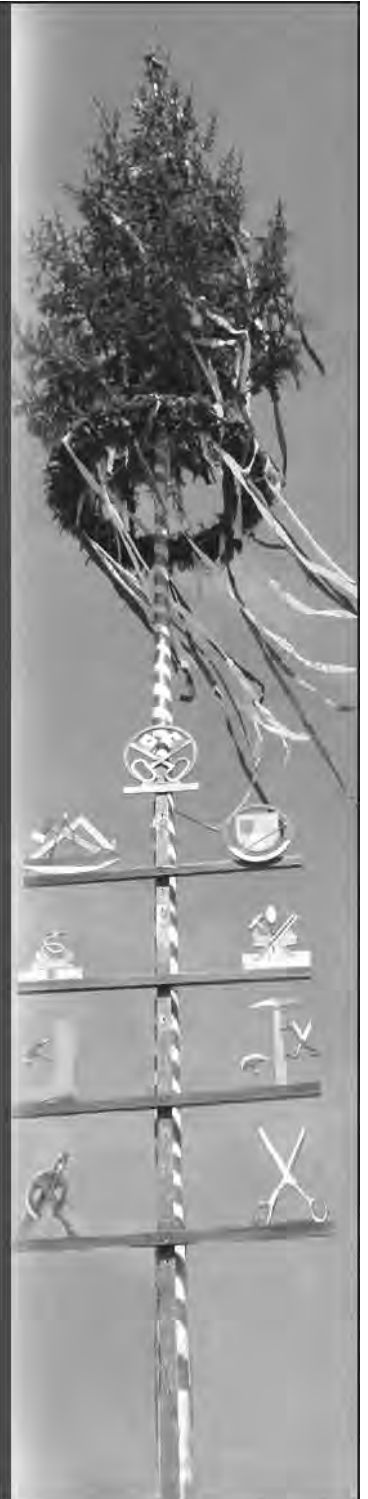
Uwe Morgenstern Bürgermeister